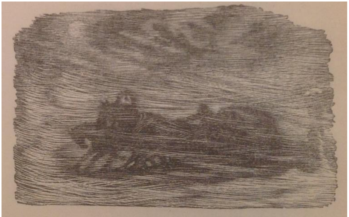
Рис.3. – Ф. Константинов. Иллюстрация к стихотворению «Бесы»