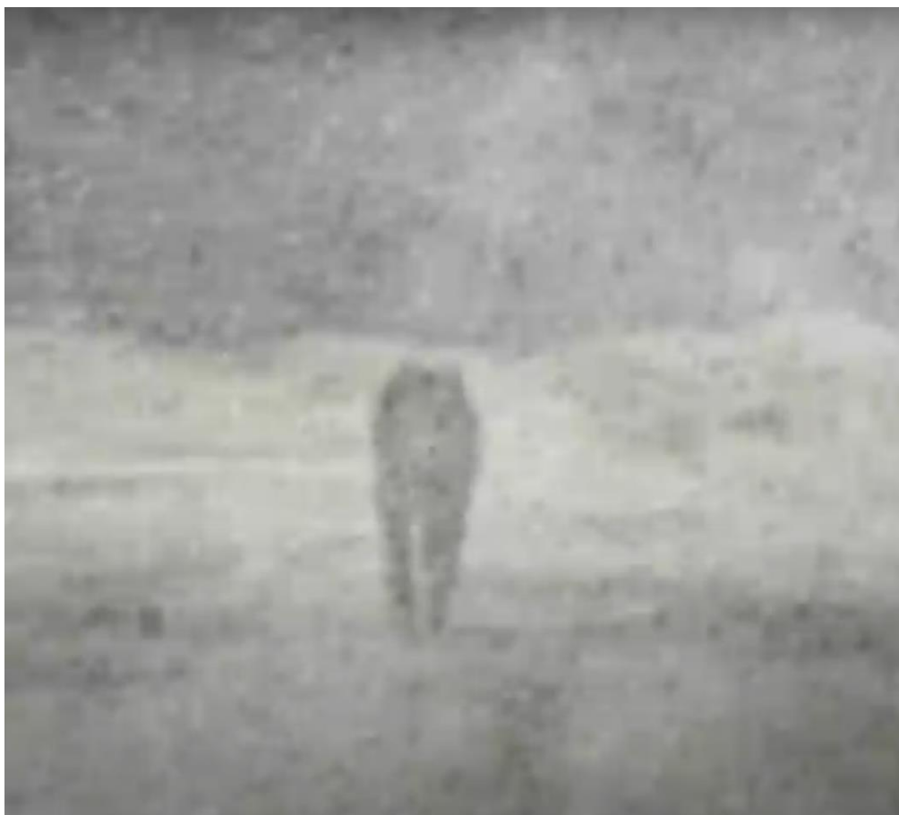
Рис.4. – Кадр из мультфильма «Капитанская дочка». Режиссер – Е. Михайлова, 2005.