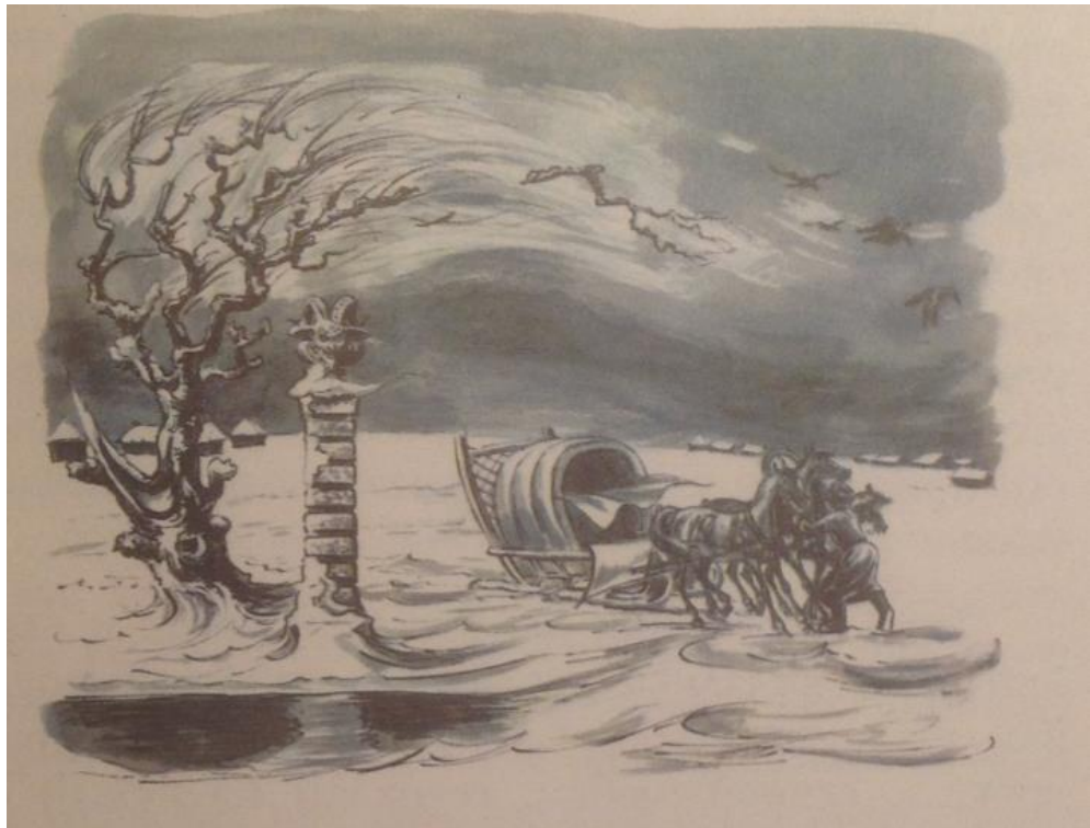
Рис.2. – В. Милашевский. Иллюстрация к повести «Метель»