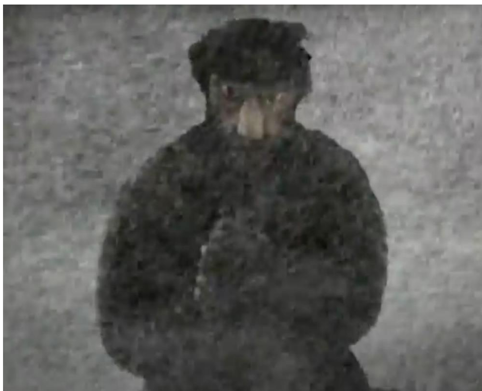
Рис.5. – Кадр из мультфильма «Капитанская дочка». Режиссер – Е. Михайлова, 2005.