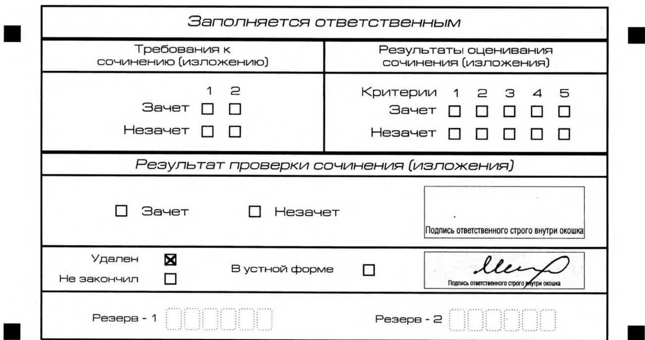
Рис. 13. Заполнение полей нижней части бланка регистрации (удаление с экзамена)

В случае если участник итогового сочинения (изложения) нарушил установленные требования, изложенные в пункте 28 Порядка проведения государственной итоговой аттестации по образовательным программам среднего общего образования (приказ Минпросвещения России и Рособрнанадзора от 4 апреля 2023 г. № 232/551), он удаляется с итогового сочинения (изложения). Член комиссии по проведению итогового сочинения (изложения) составляет «Акт об удалении участника итогового сочинения (изложения)» (форма ИС-09), вносит соответствующую отметку в форму ИС-05 «Ведомость проведения итогового сочинения (изложения) в учебном кабинете ОО (месте проведения)» (участник итогового сочинения (изложения) должен поставить свою подпись в указанной форме). В бланке регистрации указанного участника итогового сочинения (изложения) необходимо внести отметку «X» в поле «Удален». Внесение отметки в поле «Удален» подтверждается подписью члена комиссии по проведению итогового сочинения (изложения) (см. рис. 13).