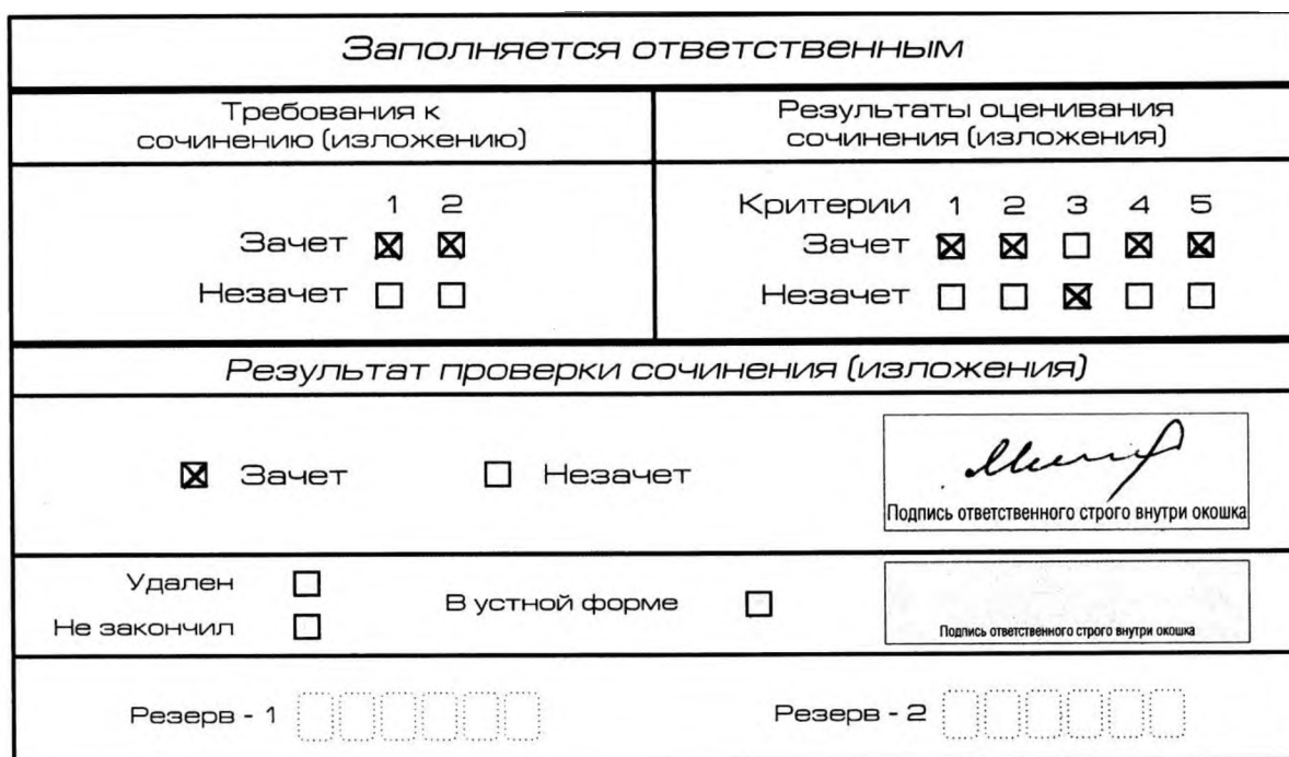
Рис. 10. Область для оценки работы

3. Во всех остальных случаях итоговое сочинение (изложение) проверяется по всем пяти критериям и оценивается по системе «зачет»/«незачет».